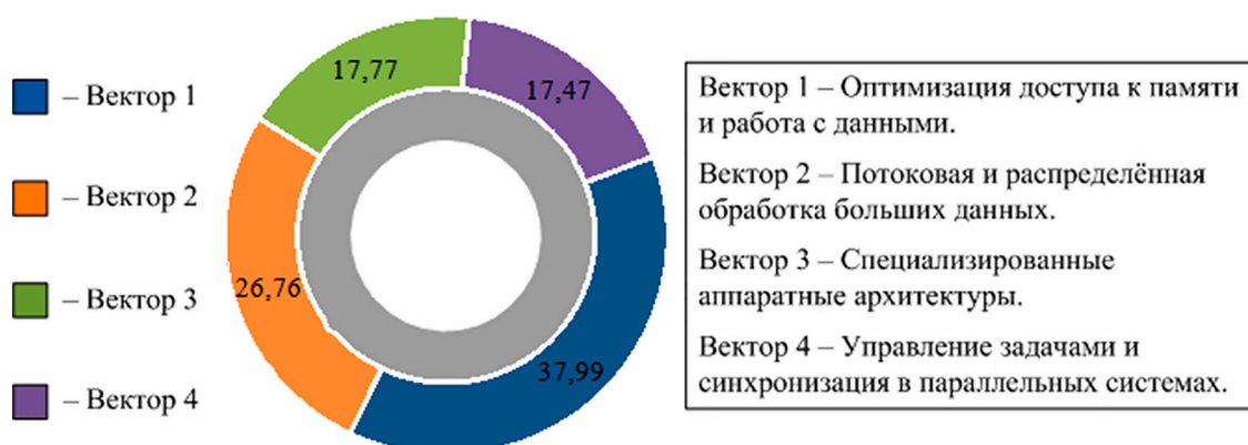
Рис. 3. Распределение патентной активности по технологическим векторам Примечание: составлен авторами по результатам данного исследования

Патентная активность в тематике параллельной обработки данных оказалась почти монопольной США (82,9 %), тогда как в научных публикациях их доля составляет лишь 38,4 % – разрыв более чем вдвое. Для научного планирования это означает, что патентный и публикационный ландшафты не совпадают и их необходимо анализировать раздельно. Присутствие Bank of America среди лидеров патентования (3249 патентов) – первый количественный сигнал того, что финансовый сектор стал самостоятельным генератором технологий параллельных вычислений. На практике патентный мониторинг должен включать не только ИТ-корпорации, но и компании из сферы финансовых услуг.