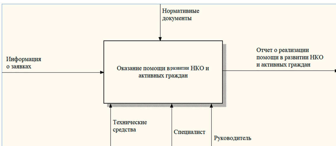
Рис. 1. Контекстная диаграмма процесса «Оказание помощи в развитии НКО»

На этапе проектирования были описаны функциональные требования к разрабатываемой платформе, построены IDEF0 -диаграммы, предназначенные для формализации и описания бизнес-процессов (рис. 1).