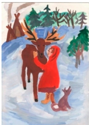
Рис. 6. Матвей Е.