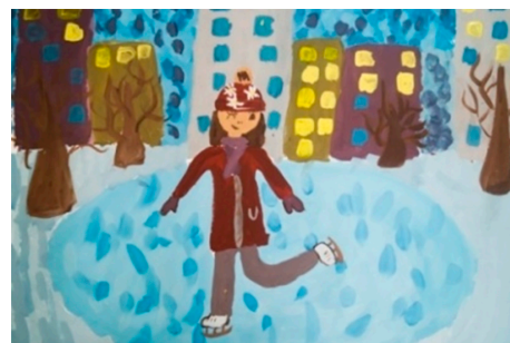
Рис. 4. Мария В.

новогоднего праздника. В работе Насти К. (рис. 5) изображены две фигуры в маскарадных костюмах, очень выразительно переданы движения танцующих зайца и лисы, причем каждый персонаж имеет разные динамичные трактовки. Также можно наблюдать улыбку в мимике на маске лисицы, что довольно иллюзорно в понимании ученицы.