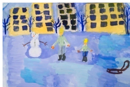
Рис. 2. Оксана Д.

Анализ работ учащихся 1 класса художественной школы позволил выявить существенные проблемы в изображении фигуры человека. Для решения задачи был разработан учебный набор специальных заданий, упражнений и тем сюжетно-тематических композиций, который представлен в табл. 3.