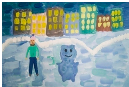
Рис. 1. Лена В.

порциональные неточности, нет построения фигуры по законам анатомической связи.