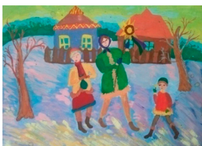
Рис. 7. Полина Ш.

Далее наш эксперимент продолжился необычным заданием для обучающихся, которое совпало с празднованием традиционного народного гуляния в «Рождественские колядки». Обучающимся было предложено изобразить многофигурные сцены из народных гуляний на «Рождественские колядки». Примером выполнения данного задания служит работа Полины Ш. (рис. 7). Таких своеобразных и интересных работ у ребят было очень много. Здесь наблюдается и выразительная динамика, и пропорции людей различного возраста, и эмоциональное настроение, переданное через детали, образы, колорит, костюмы изображенных персонажей. «Большое значение для развития образных представлений и эмоциональной сферы ребенка имеет наглядность, демонстративный материал – рисунки, фотографии, репродукции, схемы, аудио- и видеоматериалы» [7, с. 147].