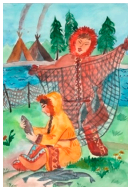
Рис. 9. Алина А.