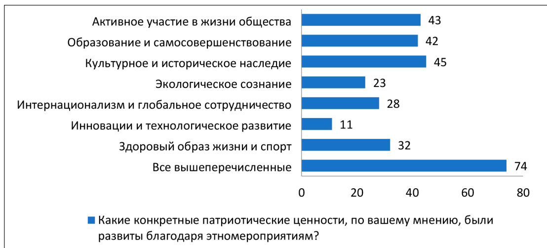
Рис. 3. Результаты исследования ранжирования студентами патриотических ценностей после участия в этномероприятиях

Анализ краткого эссе «Опишите, какие изменения в вашем восприятии патриотических ценностей произошли после участия в таких мероприятиях» (11 вопрос) продемонстрировал углубление и систематизацию изменений в восприятии патриотических ценностей, таких как национальная идентичность, потребность в изучении и сохранении своих национальных традиций и обычаев, чувство единения и взаимовыручки у 112 студентов (93,3%) от количества участвующих в этномероприятиях 6 студентов (5%) остались нейтральными. Данные мероприятия никак не повлияли на их патриотическую настроенность, а у двух студентов (1,7%) сложилось негативное отношение. Они считают, что данные мероприятия отнимают время и отвлекают от учебного процесса.