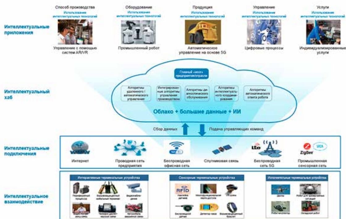
Рис. 3. Процесс цифровой трансформации промышленного предприятия [4]

Сегодня мы можем выделить несколько основных технологических направлений, предоставляющих компаниям конкурентные преимущества, а также цифровые инструменты, усиливающие преимущества бережливого производства, включая: