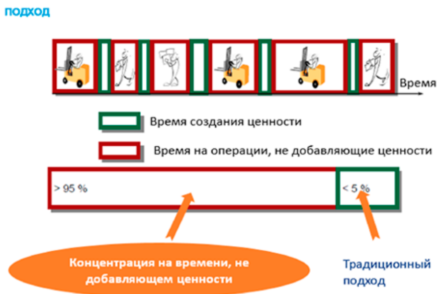
Рис. 1. Бережливое производство как средство устранения потерь

В связи с тем, что бережливое производство нацелено на создание ценности для клиента, в основании модели производственной системы выделяют ориентированность на него. Работая над устранением операций, не добавляющих ценности, «бережливым» предприятиям удастся оптимизировать затраты и делать своим клиентам более интересные ценовые предложения, чем конкуренты, оставаясь с высокой доходностью.