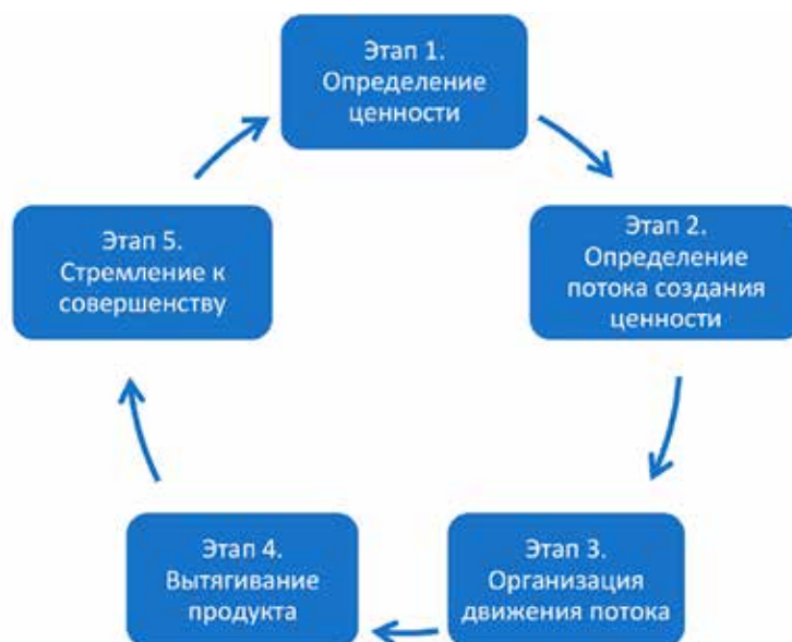
Рис. 2. Основные этапы бережливого производства [3]

Создавать ценности «бережливым» предприятиям помогают сотрудники, поэтому особо выделяют подход «уважения к сотрудникам», когда в организации активно работают над созданием безопасных условий труда, развитием сотрудников, повышением их вовлеченности, особенно в процессы улучшений.