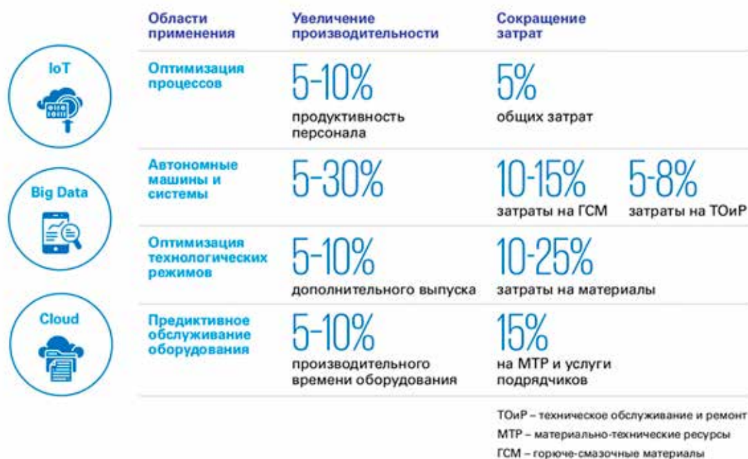
Рис. 5. Цифровизация как способ повышения эффективности предприятий [5]

Ключ к снижению производственных затрат при одновременном повышении производительности труда заключается в том, чтобы найти правильную комбинацию цифрового и традиционного бережливого производства, которая соответствует текущей ситуации и желаемому результату.