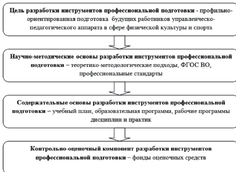
Рис. 1. Дидактическая система разработки и отбора инструментов профессиональной подготовки управленческо-педагогических кадров в сфере ФКиС

Для определения содержательного компонента инструментов профессиональной подготовки магистрантов – будущих управленцев – мы принимали во внимание положения образовательного стандарта и соответствующие специфике деятельности профессиональных стандартов «Педагог дополнительного образования детей и взрослых» [6] и «Руководитель организации (подразделения организации), осуществляющей деятельность в области физической культуры и спорта» [7].