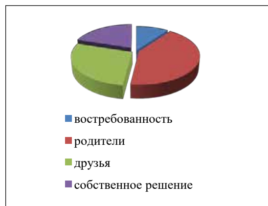
Рис. 1. Результаты опроса

повлияли ли на их выбор профессии данные консультационные мероприятия, что в итоге повлияло на их выбор профессии. Обращает на себя внимание то, что 71% опрошенных студентов участвовали в консультациях по профориентации, но из них 62% заявили, что данные мероприятия не повлияли на выбор профессии, наиболее существенными оказались мнения родителей и друзей. На рис. 1 представлены результаты опроса.