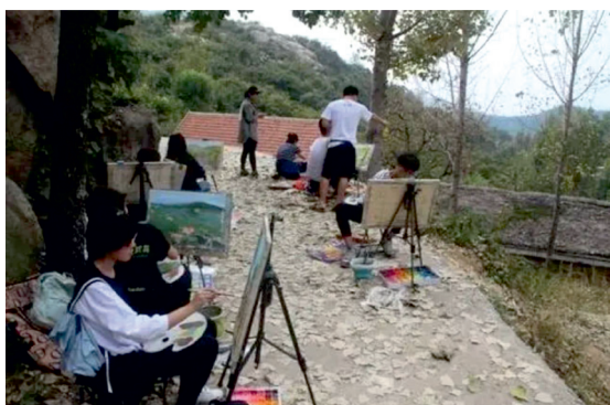
Рис. 2. Студенты-бакалавры 4 курса. Педагогический университет Шанси. 07.08.2021

Кроме этого, освоение техники акварельных этюдов в изображении пейзажей влияет на профессиональное становление будущего учителя. У обучающегося появляется собственный стиль в изображении воздушного пространства пейзажей. Чувства и эмоции, получаемые в результате пленэрной практики, формируют художественное мышление студента. Получение теоретических знаний во время пленэрной практики дает возможность понять смыслы и значение стилей и течений пейзажной живописи, эстетических представлений, методов и приемов в технике акварели.