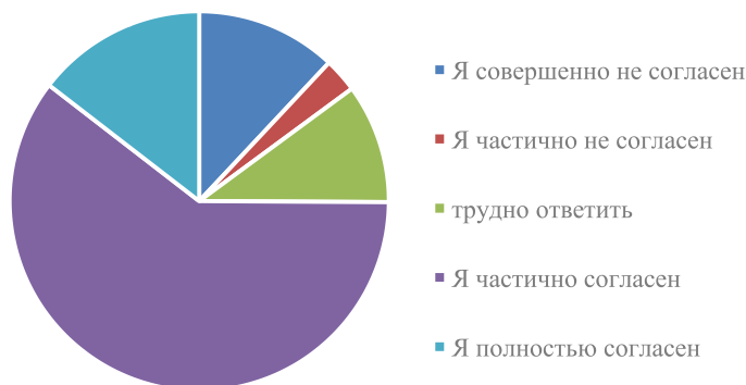
Рис. 1. Проблемы, с которыми сталкиваются учителя в классе

Большинство респондентов (60%) отмечают, что используют новые информационные технологии на занятиях. Мы можем повысить интерес учащихся к английскому языку и помочь устранить барьеры на пути изучения языка. Практично использовать различные виды работы индивидуально, в парах, группах, классах и т.д.