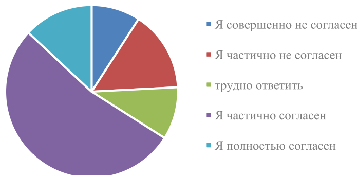
Рис. 2. Проблемы, с которыми сталкиваются учителя за пределами класса

Нехватка времени. Одним из главных препятствий для изучения английского языка является нехватка времени. Независимо от того, насколько хорошо организован и эффективен урок, если ученик не применит то, чему он научился на практике, он быстро забудет то, чему научился во время урока. Поэтому будет правильно иметь достаточно времени для развития у учащегося навыков владения английским языком.