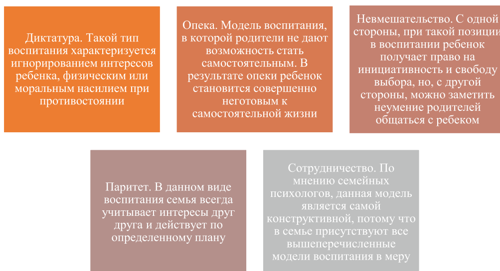
Рис. 1. Основные модели воспитания

Всем маленьким детям обязательно нужна оценка их деятельности, даже если он просто съел кашу – родителям следует его похвалить, или же если у ребенка что-то не получается, то родителям все равно нужно выразить свою поддержку и понимание. При полном отсутствии адекватной оценки деятельности ребенок пытается привлечь внимание родителей иррациональными методами, становится неуверенным в себе, это влечет за собой низкую самооценку у подрастающей личности.