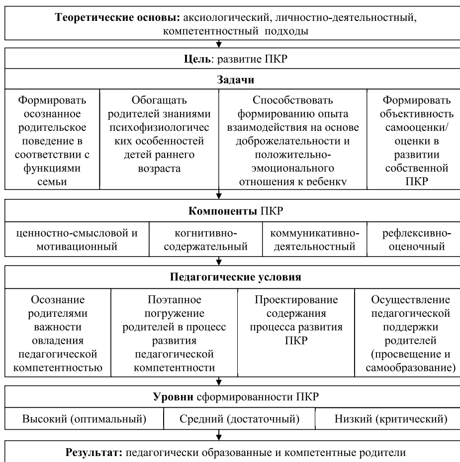
Рис. 1. Модель развития ПКР, воспитывающих детей раннего возраста, в условиях ДОО

Теоретическая подготовка реализуется в форме информационного и психолого-педагогического просвещения (лекториев, изучения и обсуждения специальной литературы, бесед, консультаций (индивидуальных и групповых)).