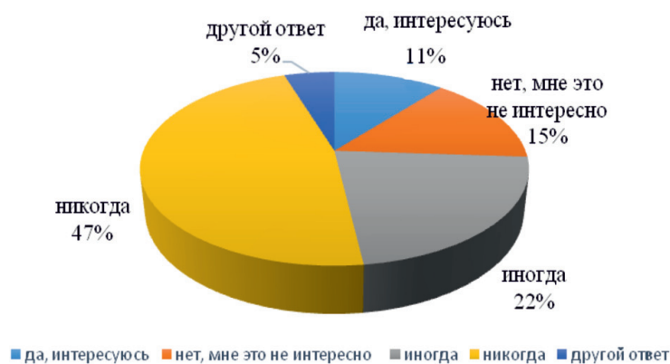
Рис. 2. Распределение ответов на вопрос «Заинтересованность молодежи политической жизнью страны»