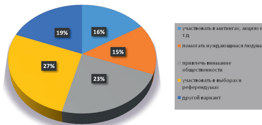
Рис. 3. Распределение ответов на вопрос «Какими способами человек может выразить свою гражданскую позицию?»

При ответе на вопрос «Какими способами человек может выразить свою гражданскую позицию?» были получены следующие данные (рис. 3).