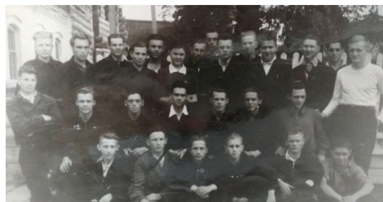
Рис. 2. Группа учащихся Яранского училища механизации, направленных на уборку урожая целинных и залежных земель (1955 г.)

После снижения показателей в 1949–1954 гг. план подготовки рабочих на 1954/55 учебный год по стране был увеличен на треть. Кировская область в это время была переведена в Управление территорий Урала, Сибири, Дальнего Востока и Средней Азии. Количество заведений трудовых резервов в области за 1954 г. увеличилось с 29 до 37, а контингент обучающихся вырос с 4826 до 9194 человек.