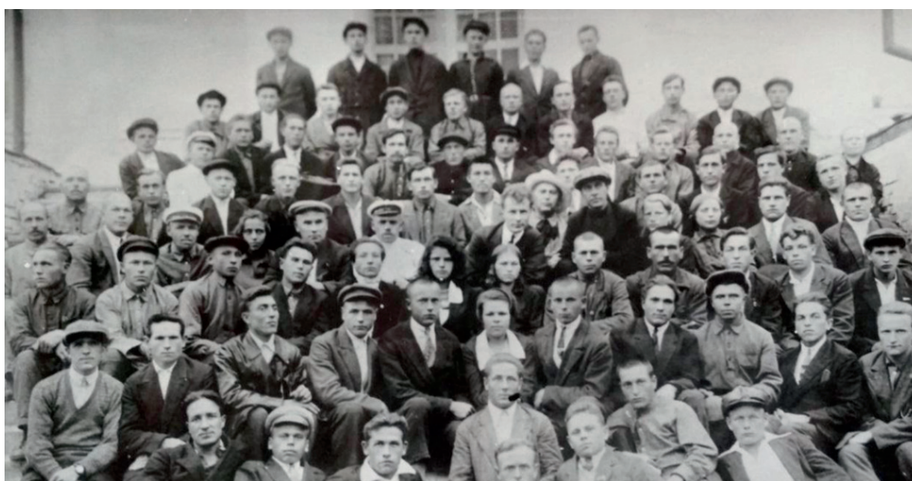
Рис. 1. Выпуск Яранской школы тракторных механиков Горьковского краевого земельного отдела. Группы А, Б, В. (1934 г.)

Следует сказать, что первый (1928–1932 гг.) и второй (1933–1937 гг.) пятилетние планы развития народного хозяйства СССР ставили задачи всеобщего образования в объеме семилетки. Предусматривалось увеличение количества учащихся всех типов заведений, не считая дошкольных, с 24,2 млн человек в 1932 г. до 36 млн человек в 1936 г.