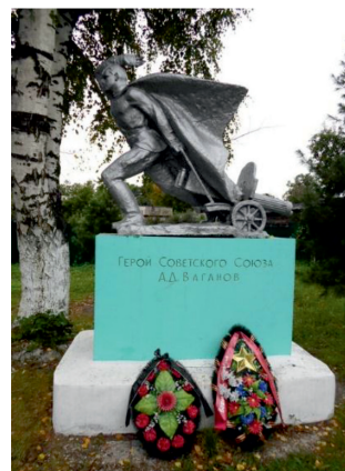
Рис. 3. Торжественное открытие памятника Герою Советского Союза А.Д. Ваганову (9 мая 1971 г.). Памятник в наши дни