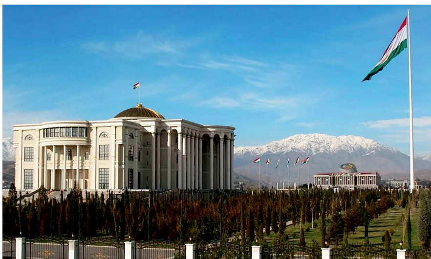
Рис. 1. Вид на Дворец нации и Государственный флаг Таджикистана

основных, приоритетных направлений деятельности Исполнительного органа государственной власти г. Душанбе и выявления путей поэтапного решения приоритетных задач [5, с. 5–8]. Кроме того, корректировке Генерального плана реконструкции столицы подлежат центральные части и ее улицы. Центральный проспект Рудаки, который является протокольным, будет застраиваться новыми стратегическими зданиями парламента страны на территории Минсельхоза и прилегающих к нему общественных и жилых зданий, которые будут вскоре снесены. На месте здания Президентского дворца, который также будет снесен, будет возведено новое здание Правительства республики. Пешеходные улицы по проспекту Рудаки будут расширены и благоустроены, на территории перед новыми зданиями пар-