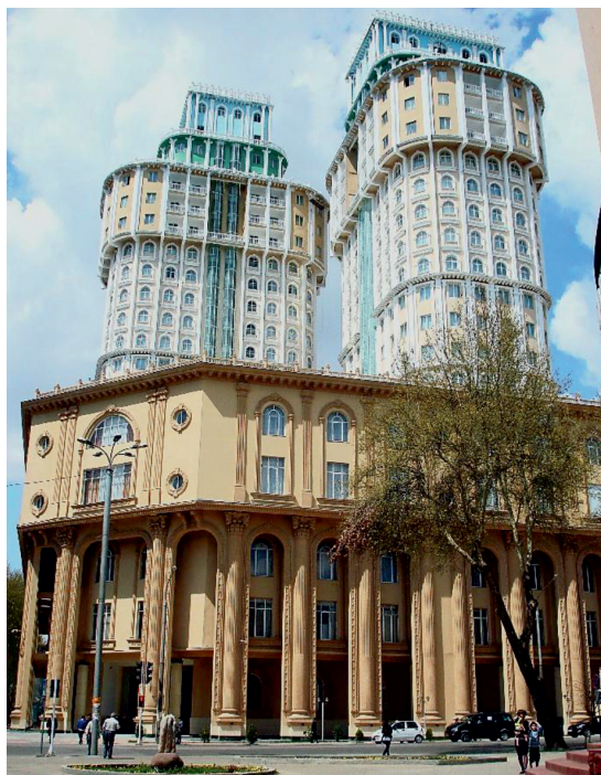
Рис. 2. Культурно-торговый центр «Душанбе-Плаза»

ным требованиям архитектуры будет разделяться на три пояса, охватывающие три зоны территории столицы. Первый пояс – это 5-этажные жилые и административные здания. Второй пояс – это 3-этажные жилые и административные здания, а третий пояс – это высотные жилые и административные здания. Распределение территории города Душанбе по зонам имеет цель снести те здания и объекты, которые ныне не отвечают требованиям стандартов.