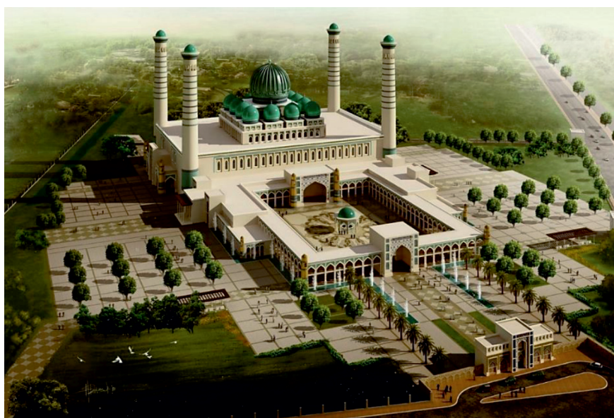
Рис. 7. Здание новой мечети

Одна из особенностей современной практики строительства последних лет – это возрождение традиций таджикского народа и разработка синтеза архитектурных стилей Востока и Запада. В градостроительстве города Душанбе необходимо рассмотреть и применить новый принцип архитектурно-планировочной организации жилой застройки средней этажности с общественным обслуживанием на горном рельефе. Также при строительстве новых высотных зданий необходимо учесть высокую сейсмичность