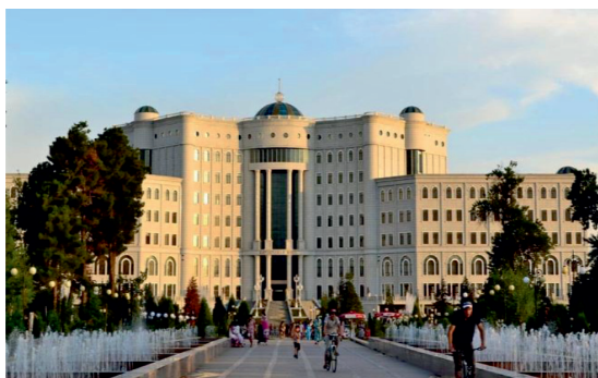
Рис. 4. Национальная библиотека Таджикистана