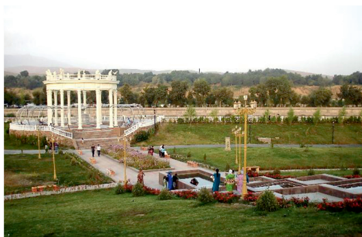
Рис. 5. Столичный парк «Пойтахт»