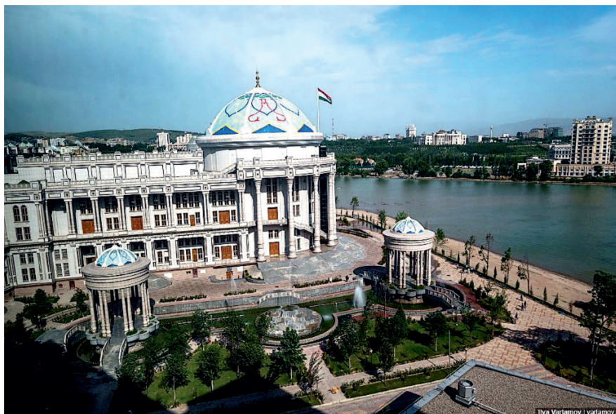
Рис. 6. Здание дворца «Коху Навруз»