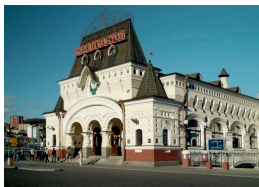
Рис. 2. Реклама в городе Владивостоке

Цель ландшафтного дизайна состоит в восстановлении экологического равновесия между природными и антропогенными компонентами окружающего человека мира. Ландшафтный дизайн – это внесение в городскую ткань элементов природы и обеспечение максимально комфортных условий (функциональных, физиологических, психологических и других) для человека. Ландшафтная архитектура является средством взаимодействия культуры и природы, инструментом культурной деятельности человека, средством качественного обновления и возрождения городской среды в преобразовании исторической части города.