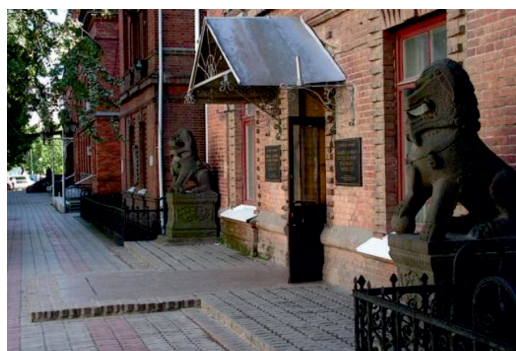
Рис. 3. Исторические здания Владивостока, фасады которых следует отреставрировать